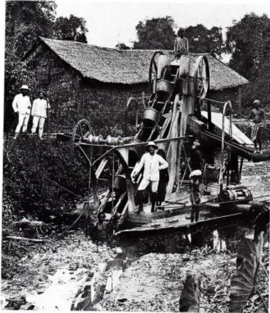
Op een baggermolen in Deli poseren een Nederlandse ondernemer en zijn personeel. Ze hebben even het ontginnen van land ten behoeve van het verbouwen van tabak onderbroken.

Door de liberale grondwet van 1848 verschoof in Nederland de macht van de koning naar het parlement. Daarin gingen liberale politici de toon aangeven.