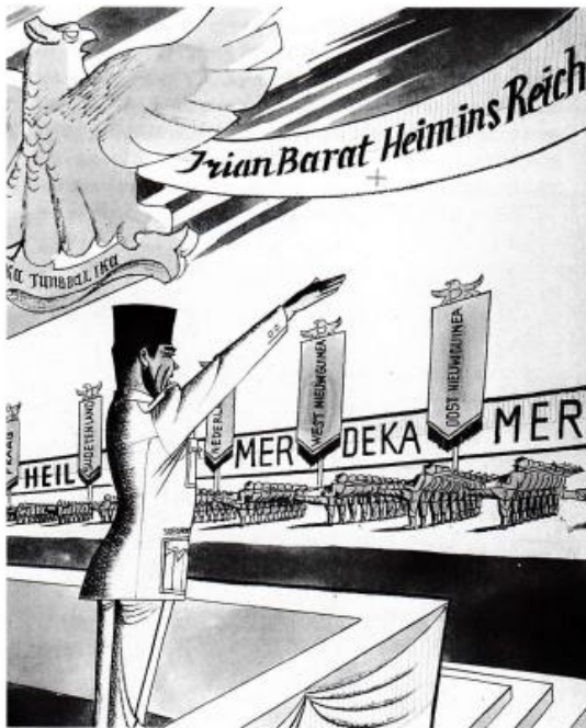
Tekenaar Eppo Doeve publiceerde op 6 januari 1962 in Elseviers Weekblad zijn visie op de toenemende spanningen tussen Nederland en Indonesië rond Nieuw-Guinea (Irian Barat genoemd door de Indonesiërs). Onder de tekening schreef hij 'Und wir fahren ...'. Welke overeenkomst ziet Doeve? In hoeverre klopt zijn vergelijking niet?

De belangrijkste oorzaak van deze slechtere politieke verhoudingen was de Nieuw-Guinea-kwestie.